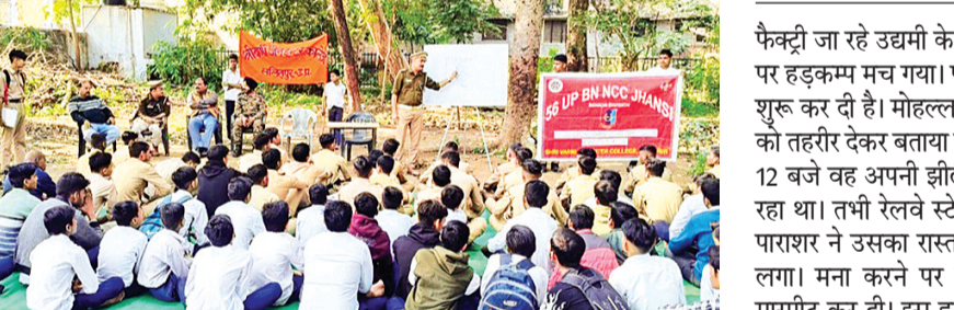
हरिभूमि न्यूज़ ललितपुर