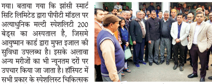
हरिभूमि न्यूज़ ललितपुर

जिलाधिकारी शसत्य प्रकाश के निर्देशन में कलेक्ट्रेट परिसर में झांसी की एंजेल स्मार्ट सिटी हॉस्पिटल के द्वारा निःशुल्क स्वास्थ्य परीक्षण शिविर लगाया गया, जिसका जिलाधिकारी ने फीता काटकर शुभारंभ किया। मौके पर जिलाधिकारी ने स्मार्ट सिटी हॉस्पिटल के मोबाइल चार्जिंग स्टेशन का भी शुभारंभ किया। जिलाधिकारी ने कहा कि ललितपुर के लोगों को बेहतर स्वास्थ्य सेवाओं का लाभ मिले, इसके लिए एंजेल स्मार्ट सिटी हॉस्पिटल की ओर से यह शिविर लगाया गया है, हॉस्पिटल में लगभग सभी डिपार्टमेंट्स के स्पेशलिस्ट उपलब्ध हैं और आयुष्मान योजना का लाभ भी दिया जाता है। इसके साथ ही जांचे भी न्यूनतम दर पर हो जाती हैं। शिविर में हॉस्पिटल के स्पेशलिस्ट चिकित्सकों के द्वारा कलेक्ट्रेट के अधिकारी/कर्मचारी व मीडिया बंधुओं का स्वास्थ्य परीक्षण किया गया व परामर्श दिया गया। बताया गया कि झांसी स्मार्ट सिटी लिमिटेड द्वारा पीपीटी मॉडल पर अत्याधुनिक मल्टी स्पेशलिटी 200 बेड्स का अस्पताल है, जिसमें आयुष्मान कार्ड द्वारा मुफ्त इजाल की सुविधा उपलब्ध है। इसके अलावा अन्य मरीजों का भी न्यूनतम दरों पर उपचार किया जा जाता है। हॉस्पिटल में सभी प्रकार के स्पेशलिस्ट चिकित्सक उपलब्ध हैं। आज जनजागरूकता के लिए यह कैम्प लगाया गया है।