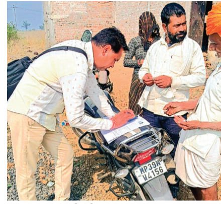
हरिभूमि न्यूज ▶▶ राजगढ़

जिले में मतदाता सूचियों के गहन पुनरीक्षण (एसआईआर) कार्य अब तेज गति से होने लगा है। निर्वाचन से जुड़ा यह अति महत्वपूर्ण कार्य गत 04 नवंबर से आरंभ हुआ था। शुरुआत के कुछ दिनों तक बीएलओ व अन्य कर्मचारियों को गणना पत्रकों के वितरण में लग गया। ऐसे में शुरुआत में राजगढ़ जिला एसआईआर कार्य में प्रदेश की अंडर फाइव जिलों की सूची में था। लेकिन, अधिकारियों की सतत मॉनिटरिंग