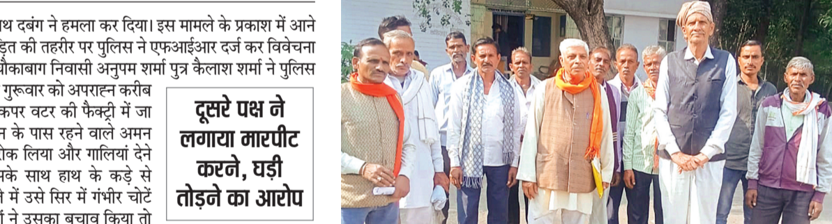
हरिभूमि न्यूज़ ललितपुर