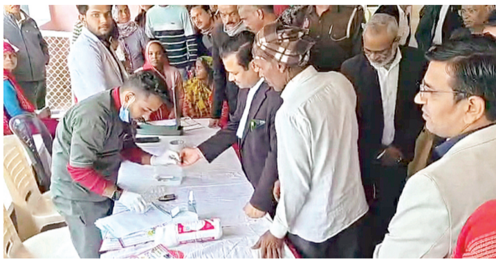
हरिभूमि न्यूज़ ललितपुर

जिलाधिकारी शसत्य प्रकाश के निर्देशन में कलेक्ट्रेट परिसर में झांसी की एंजेल स्मार्ट सिटी हॉस्पिटल के द्वारा निःशुल्क स्वास्थ्य परीक्षण शिविर लगाया गया, जिसका जिलाधिकारी ने फीता काटकर शुभारंभ किया। मौके पर जिलाधिकारी ने स्मार्ट सिटी हॉस्पिटल के मोबाइल चार्जिंग स्टेशन का भी शुभारंभ किया। जिलाधिकारी ने कहा कि ललितपुर के लोगों को बेहतर स्वास्थ्य सेवाओं का लाभ मिले, इसके लिए एंजेल स्मार्ट सिटी हॉस्पिटल की ओर से यह शिविर लगाया गया है, हॉस्पिटल में लगभग सभी डिपार्टमेंट्स के स्पेशलिस्ट उपलब्ध हैं और आयुष्मान योजना का लाभ भी दिया जाता है। इसके साथ ही जांचे भी न्यूनतम दर पर हो जाती हैं। शिविर में हॉस्पिटल के स्पेशलिस्ट चिकित्सकों के द्वारा कलेक्ट्रेट के अधिकारी/कर्मचारी व मीडिया बंधुओं का स्वास्थ्य परीक्षण किया गया व परामर्श दिया गया। बताया गया कि झांसी स्मार्ट सिटी लिमिटेड द्वारा पीपीटी मॉडल पर अत्याधुनिक मल्टी स्पेशलिटी 200 बेड्स का अस्पताल है, जिसमें आयुष्मान कार्ड द्वारा मुफ्त इजाल की सुविधा उपलब्ध है। इसके अलावा अन्य मरीजों का भी न्यूनतम दरों पर उपचार किया जा जाता है। हॉस्पिटल में सभी प्रकार के स्पेशलिस्ट चिकित्सक उपलब्ध हैं। आज जनजागरूकता के लिए यह कैम्प लगाया गया है।